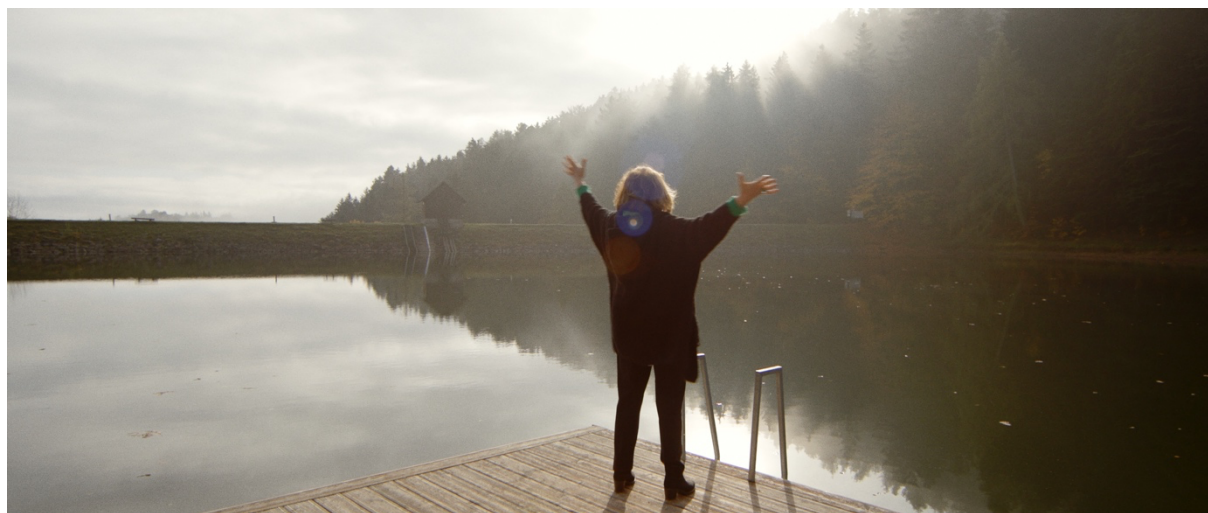
Emília Vašáryová v dokumentu Martina Šulíka Emília

Říjen v Šumperku bude ve znamení premiéry Middle Art Festivalu filmu a designu. Mladý zakladatel věří v mezinárodní potenciál. Letošním hlavním hostem je slovenská herečka Emília Vašáryová.